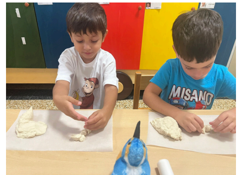
Costruiamo Mel con la pasta di sale KOALA