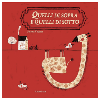
“Quelli di sopra e quelli di sotto”

C'è un solo mondo per tutti! C'è una sola Terra. C'è chi nasce di qua e chi nasce di là. Alcuni sopra e altri sotto. Poi le stagioni girano, e quando qua è inverno, là è estate, qua si semina, là si raccoglie. Quelli di sopra e quelli di sotto, scritto e illustrato da Paloma Valdivia, è un albo che con grande semplicità ed efficacia ci racconta il mondo e le sue differenze senza pretendere di spiegarle. Semplicemente esistono. E malgrado le differenze, o forse proprio grazie ad esse, come scrive l'autrice, siamo tutti uguali nella diversità.