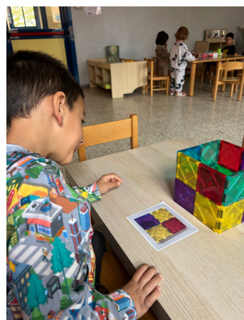
Riconoscimento e ricostruzione del cubo LUPI

è una storia su un orso gentile che salva le farfalle che cadono nel lago. Un giorno, però, Orso cade in acqua e non sa nuotare; in suo soccorso arrivano tutte le farfalle che aveva salvato, che lo trasportano in salvo, dimostrando che le buone azioni tornano indietro. La storia è incentrata sui temi dell'amicizia, della bontà e della forza dell'unione.