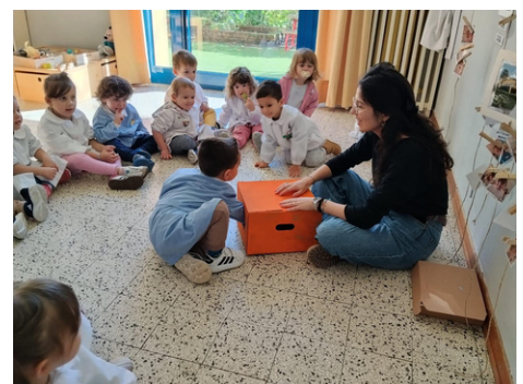
Scatola immersiva dell'autunno LITTLE BEARS