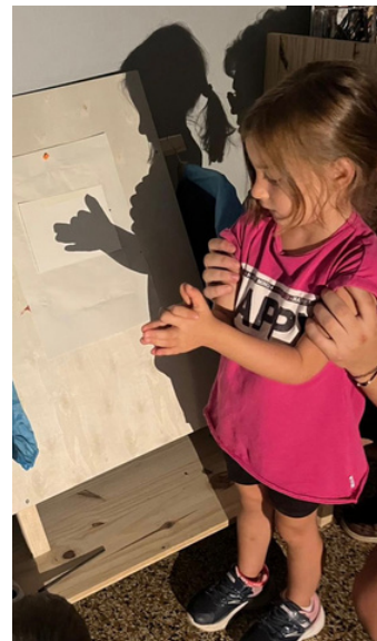
L'ombra del lupo BRUCHI

C'è un solo mondo per tutti! C'è una sola Terra. C'è chi nasce di qua e chi nasce di là. Alcuni sopra e altri sotto. Poi le stagioni girano, e quando qua è inverno, là è estate, qua si semina, là si raccoglie. Quelli di sopra e quelli di sotto, scritto e illustrato da Paloma Valdivia, è un albo che con grande semplicità ed efficacia ci racconta il mondo e le sue differenze senza pretendere di spiegarle. Semplicemente esistono. E malgrado le differenze, o forse proprio grazie ad esse, come scrive l'autrice, siamo tutti uguali nella diversità.