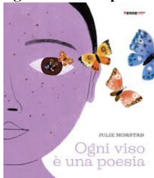
“Ogni viso è una poesia”

Questo albocelebra la bellezza e l'unicità di ogni individuo, paragonando ogni volto a una poesia unica e irripetibile. Il libro esplora i tratti del viso (occhi, naso, lentiggini, ecc.) come dettagli che compongono un'opera personale, incoraggiando a guardare gli altri con curiosità e rispetto per apprezzare la diversità. È un invito a riflettere su come i volti raccontino storie, emozioni e la ricchezza delle differenze.