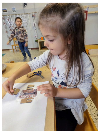
Trasformazione degli oggetti RONDINI