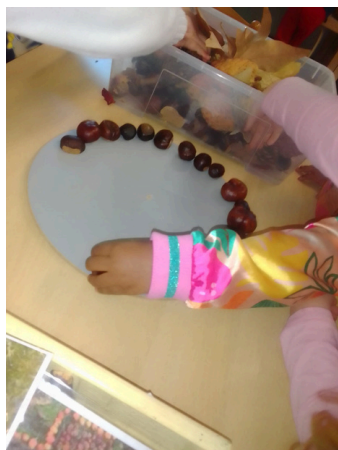
Mandala di autunno LIBELLULE