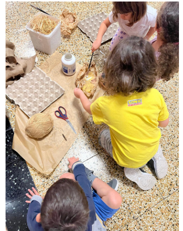
Costruiamo il nido per Mel PANDA